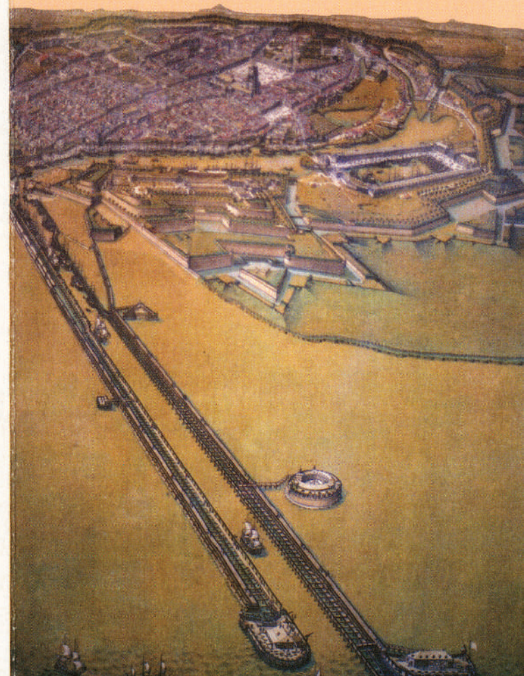
Dunkerque au 17e siècle